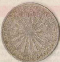
Die Beute: Diese Münze ertauchte Andreas Brinks 1970.